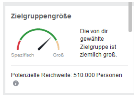
Größe der Zielgruppe innerhalb der Facebook Ads

Je mehr Kriterien Du für die Eingrenzung Deiner Zielgruppe festlegst, desto kleiner und spezifischer wird sie. Jedes Mal, wenn Du Änderungen vornimmst – also weitere Kriterien auswählst – errechnet Facebook die Anzahl der User innerhalb der Zielgruppe neu. Dabei wird Dir die Größe der Anspruchsgruppe sowohl in einer Grafik als auch als Wert angezeigt.