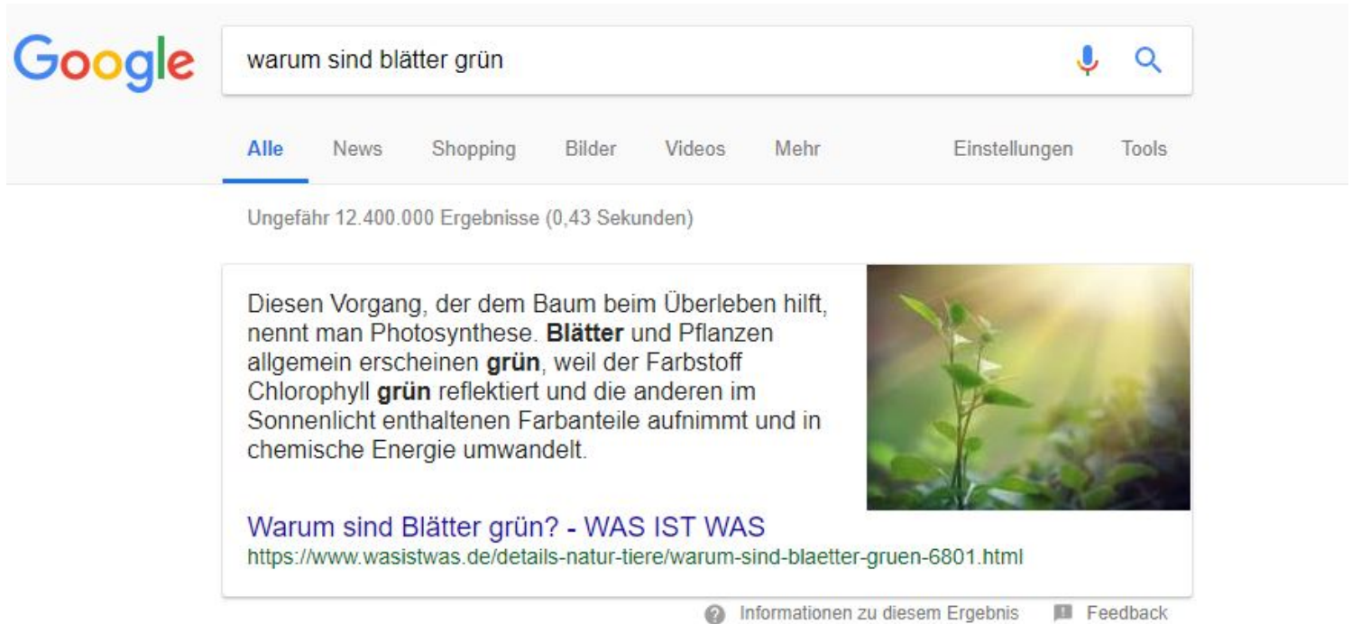
Beispiel eines Text Snippets

gibt unterschiedliche Darstellungsarten von Featured Snippets. Die Formate reichen vom regulären Text über Videos bis hin zu Listen und Tabellen. Unter dem Content werden Titel und URL der Webseite, welche als Informationsquelle dient, angegeben und verlinkt.