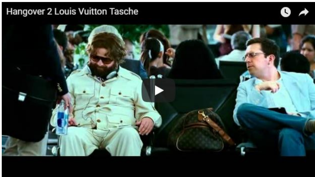
Product Placement in Hangover (2011)

Nicht immer sind Product Placements ein abgekatertes Spiel: In Hangover 2 (2011) wird in einer Filmszene eine Louis Vuitton Tasche im Eifer des Gefechts vom Sitz geworfen. Daraufhin regte sich einer der Hangover Boys auf und nennt sogar den Markennamen: „So darf man mit einer Tasche von Louis Vuitton nicht umgehen!“.