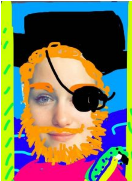
Aye Aye Captain - Snapchat Fun

Snapchat bietet Dir als User verschiedene Tools an, die Du nutzen kannst, um Dein Bild optisch zu verändern . Zunächst einmal hast Du die Möglichkeit, nachdem Du ein Bild gemacht hast, dieses mit vier verschiedenen Filtern zu belegen. Deinem Bild kann dadurch ein leichter Blaustich verpasst werden, Du kannst die Farbe des Fotos zu schwarz-weiß ändern oder der Snap wird aufgehellt/verdunkelt. Außerdem kannst Du die Uhrzeit, das Datum, Deinen Akkustand , die Grad Zahl , den Ort und die Kompassrichtung in verschiedener Ausführung über Dein Bild legen.